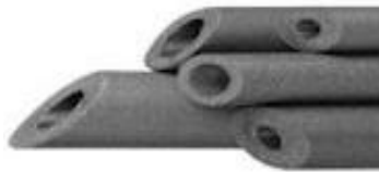
Izolācijas čaula 2m 9mm (cena par 1m)