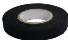
Mitrumizturīga līmlenta MELNA