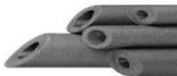
Izolācijas čaula 2m 6mm (cena par 1m)