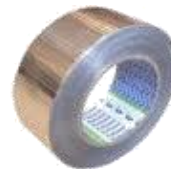
Alumīnija līmlenta armēta