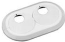
Dekoratīvā dubultā rozete (balta)