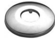
Dekoratīvā rozete (hromēta)