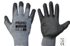
Darba cimdi PRIMO