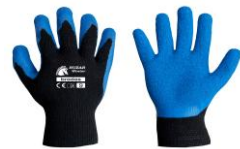
Darba cimdi HUZAR Winter