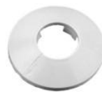
Dekoratīvā rozete (balta)