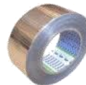
Alumīnija līmlenta armēta