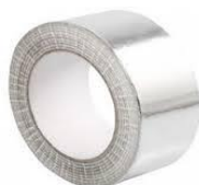
Alumīnija līmlenta gluda